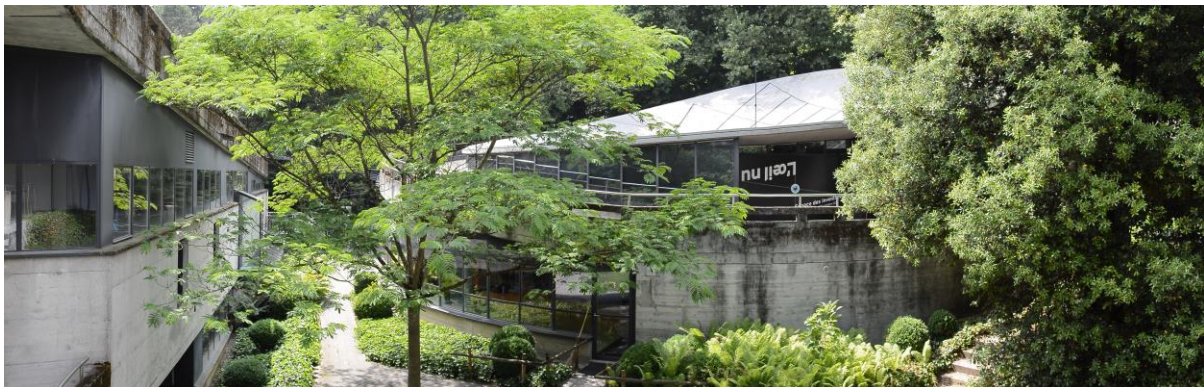
A l'Espace des inventions et dès le 21 novembre 2018, les arbres seront aussi à l'intérieur

L'exposition s'adressera en premier lieu aux enfants entre 6 et 14 ans mais sera conçue de manière à offrir de l'intérêt pour un public plus large. Elle se déroulera sur les deux étages du bâtiment de la Rotonde où se situe l'Espace des inventions et offrira ainsi une visite sur plus de 400 m 2 .