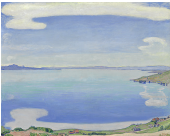
Ferdinand Hodler, Le Léman vu de Chexbres, vers 1904, huile sur toile, 81 x 100 cm, collection privée

Plus d'informations et inscriptions sur www.museedartdepully.ch