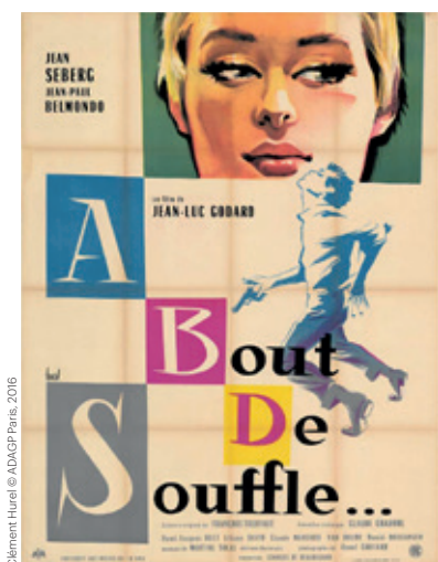
Clément Hurel , 1960, affiche française (166x128,5 cm), A bout de Souffle , Jean-Luc Godard, France (1959)

A l'occasion du 70 e anniversaire de la Cinémathèque suisse, le Musée d'art de Pully s'associe à l'institution nationale pour une exposition consacrée à ces trésors iconographiques.