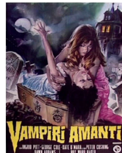
Renato Casaro , 1972, affiche italienne (136x198 cm), The Vampire Lovers , Roy Ward Baker, Grande- Bretagne (1970)

Née en 1948 à l'initiative des membres du Ciné-club de Lausanne, la Cinémathèque suisse est reconnue comme étant la 6 e du monde en termes de collection. Selon la Fédération Internationale des Archives du Film (FIAPF), seules quelques collections aux Etats-Unis, en Grande Bretagne, en Russie ou en France devancent celle réunie en Suisse. Réputée pour son ampleur et sa variété, l'institution conserve des films de fiction et des documentaires de toutes provenances ainsi que des milliers d'heures de documents filmés en tous genres. A l'instar des institutions similaires dans le monde, la Cinémathèque suisse collecte tout ce qui a trait au cinéma diffusé dans le pays. Ses collections se composent ainsi non seulement de la production nationale mais également de films internationaux. Elles sont enrichies de tout ce qui témoigne de l'industrie cinématographique : affiches, photos et dossiers de presse, revues de presse, scénarios, fonds d'archive de réalisateurs et appareils cinématographiques.